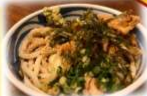
イカ入りぶっかけうどん